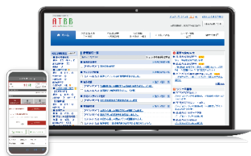
ATBB (不動産業務総合支援サイト)