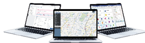
不動産業務支援サービス

アットホーム株式会社（注）HP： https://www.athome.co.jp/corporate/